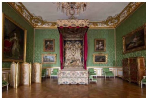
La chambre du Dauphin, fils de Louis XV, rouvre après 18 mois de restauration.