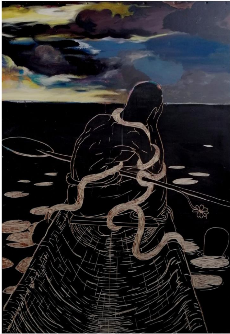
Untilted , Technique mixte, Contreplaqué gravé et acrylique