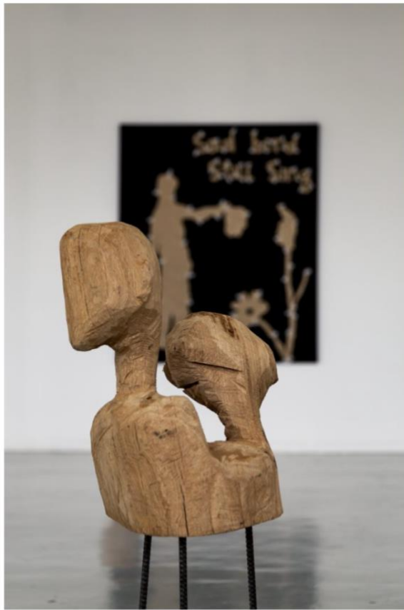
AynkɛnDropsy , Technique mixte, Chêne rouge d'Amérique, vis à placo, fer à béton