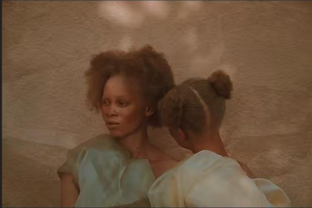
KEREN LASME, Untitled I, Beneath our skin lies the sun, 2019, photographie

Chercheuse et artiste pluridisciplinaire, Keren Lasme est titulaire d'une maîtrise en études africaines avec une spécialisation en philosophie. Elle explore différentes voies en matière de contemplations, de réflexions et de perspectives comparables à la mise en scène des sociétés matérielles et non matérielles de l'Afrique. Cette série est un hommage à l'excellence, la force et la délicatesse des jeunes femmes albinos ivoiriennes.