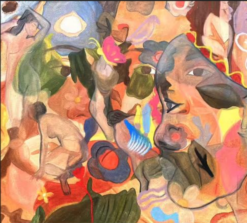
CYNTHIA COLNEY, Nature vivante, 2022, huile et pastel sur toile