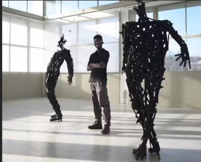
Nkonsankonson, Acrylique sur bois, 2017 – 2018